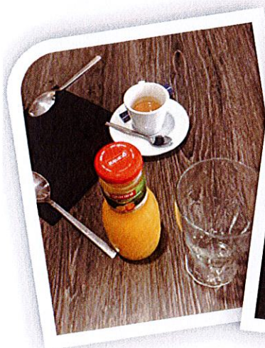
Sorties au café