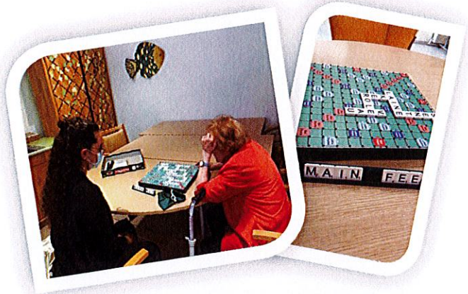
Jeux de société

Qui dit rentrée, dit reprise des activités !