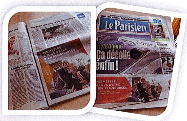
Revue de presse