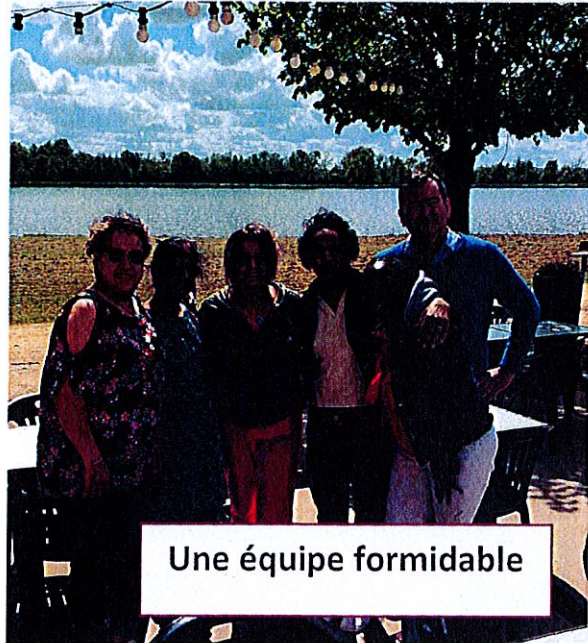
Une équipe formidable