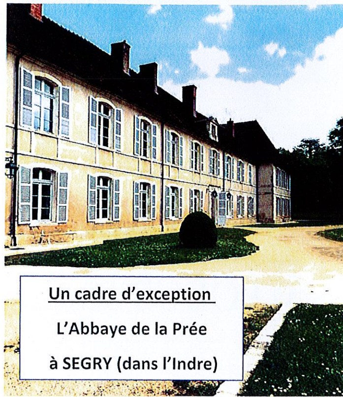
Un cadre d'exception L'Abbaye de la Prée à SEGRY (dans l'Indre)

Au cours de ce séjour, dans la relation soignant/soigné, avez-vous observé des différences de comportement ?