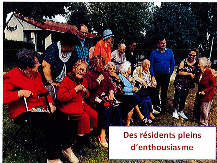
Des résidents pleins d'enthousiasme