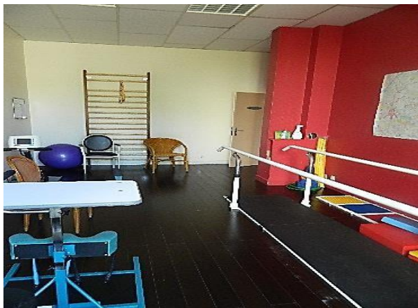
Salon de balnéothérapie